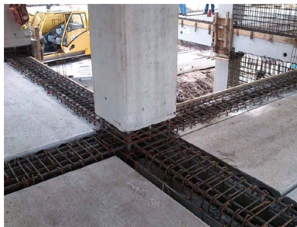
Figura 2 Ejemplo de Conexión emulativa [4]

Aunque la clasificación de las conexiones que se han mencionado hasta aquí es una de las que más se utiliza a nivel literario, lo cierto es que existen una cantidad de conexiones que se usan en la práctica que son difíciles de encajar en alguna de las categorías mencionadas. La figura 2 muestra un tipo de conexión húmeda emulativa.