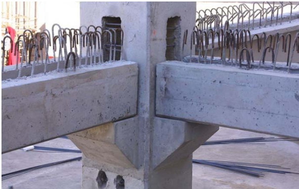
Figura 4 Ejemplo de conexión de ventana [10]

se puede dar el caso la utilización de ménsulas provisionales, las cuales son metálicas y se atornillan temporalmente a una o varias caras de la columna evitando el uso de puntales. La figura 4 muestra un tipo de conexión de ventana con traves U que llegan al nodo. También, en la figura 5 se aprecia una columna prefabricada recién colada a la cual se le han dejado las preparaciones para realizar la conexión de ventana.