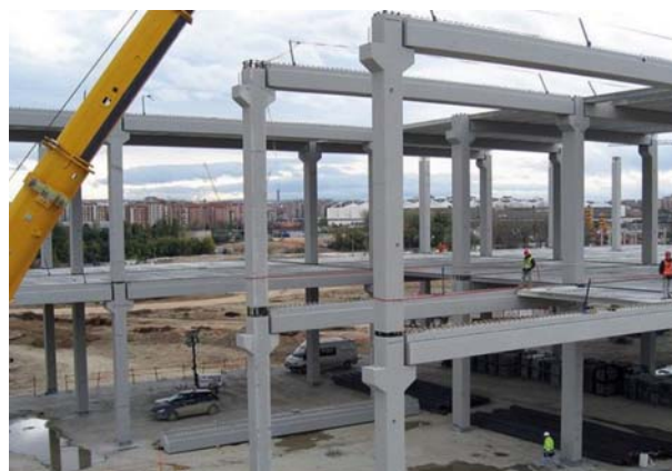
Figura 1 Estructura prefabricada en construcción [1]

La situación cambia drásticamente en el sector de infraestructura. Por ejemplo, en la construcción de puentes, en donde no nos podemos imaginar que en estos días que se construyan estas estructuras por métodos tradicionales (colados en sitio), excepto la cimentación, prácticamente el resto de la estructura es prefabricada.