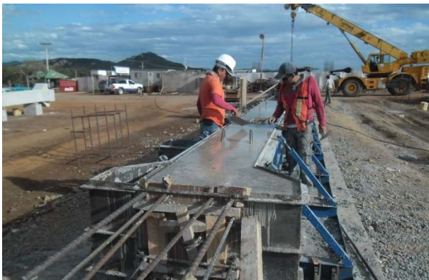
Figura 5 Columna prefabricada recién colada

Otro tipo de conexión muy interesante y que se está aplicando en México es el que se muestra en la figura 2 . Información más detallada se puede encontrar en la referencia [9] de este texto.